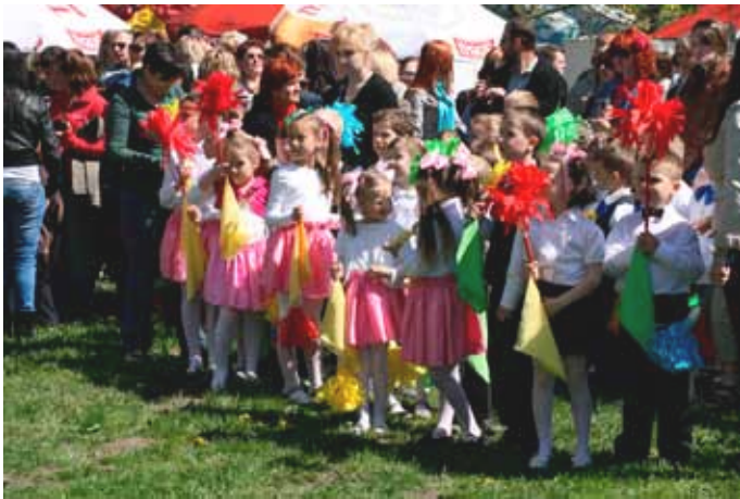
30 kwietnia - prezentacje placówek oświatowych i zespołów z Nowogardzkiego Domu Kultury