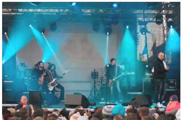
1 maja - koncert Stachursky