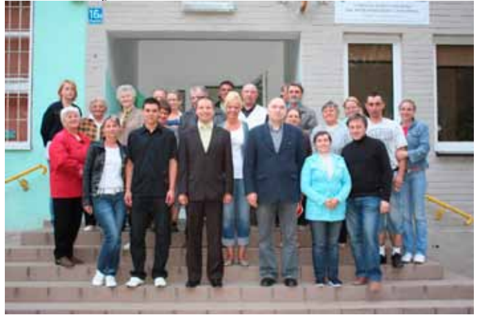
Wybory w Długołęce...