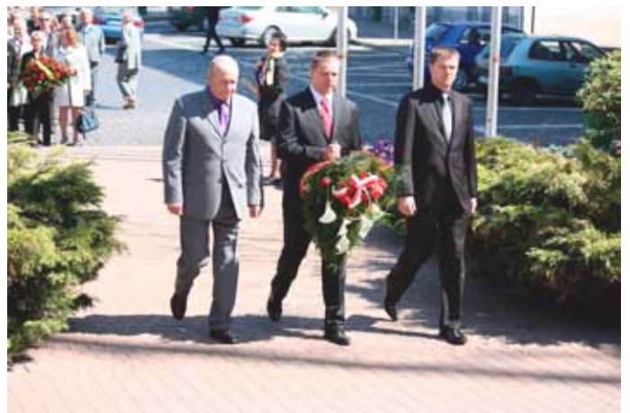
1 maja - Międzynarodowe Święto Pracy