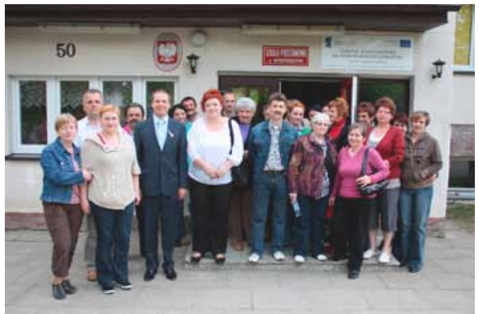
...i w Wierzbęcinie.