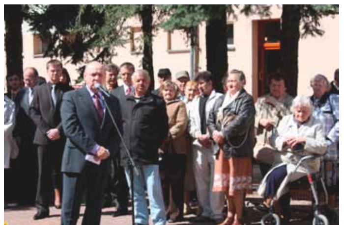
3 maja - Święto Konstytucji 3 Maja