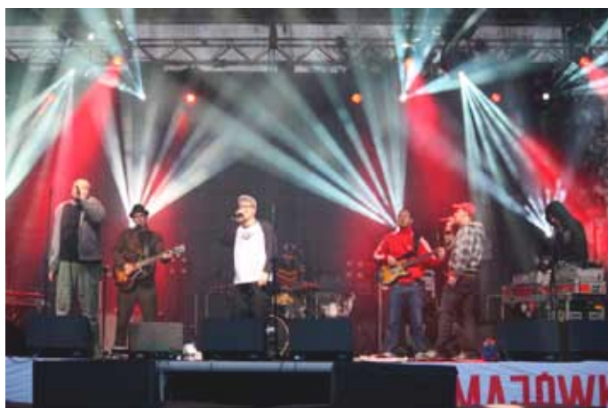
30 kwietnia - koncert zespołu VAVAMUFFIN