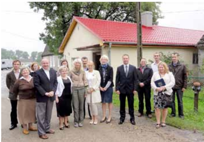
Świetlica w Wojcieszynie