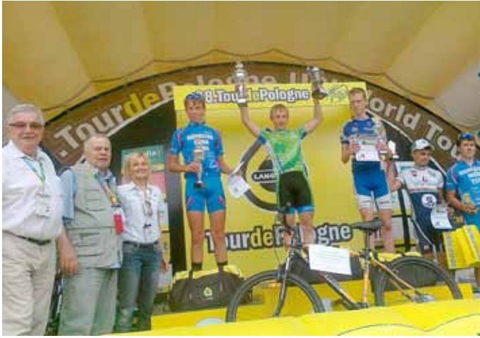
Puchar Nadziei Olimpijskich