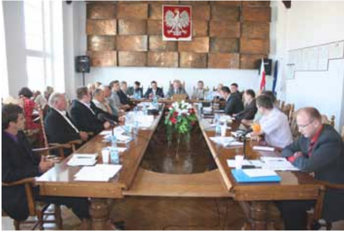
Poznajcie prawdę, a prawda Was wyzwoli