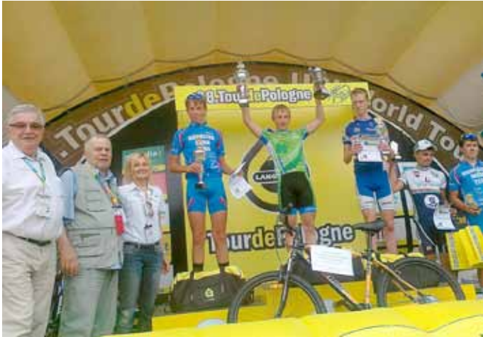
Puchar Nadziei Olimpijskich