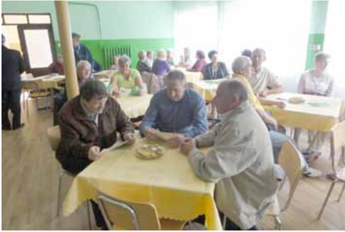
Polski Związek Działkowców