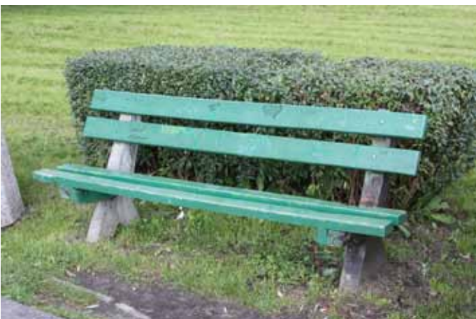
Ławki przed wymianą