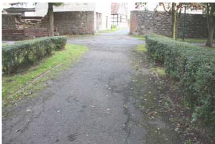
a tak wyglądało przed remontem