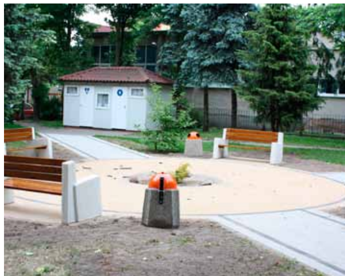
Chodnik przed i po remoncie