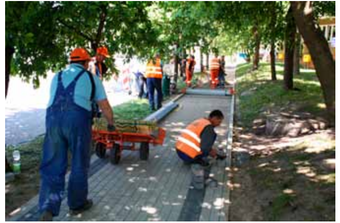
Chodnik na ul. 15 Lutego

Rozpoczęły się prace związane z wymianą nawierzchni alejek wzdłuż murów obronnych nad nowogardzkim jeziorem.