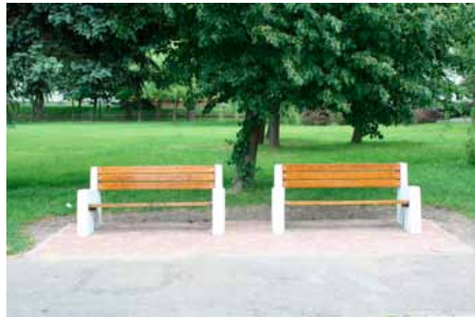
Ławki przed i po remoncie