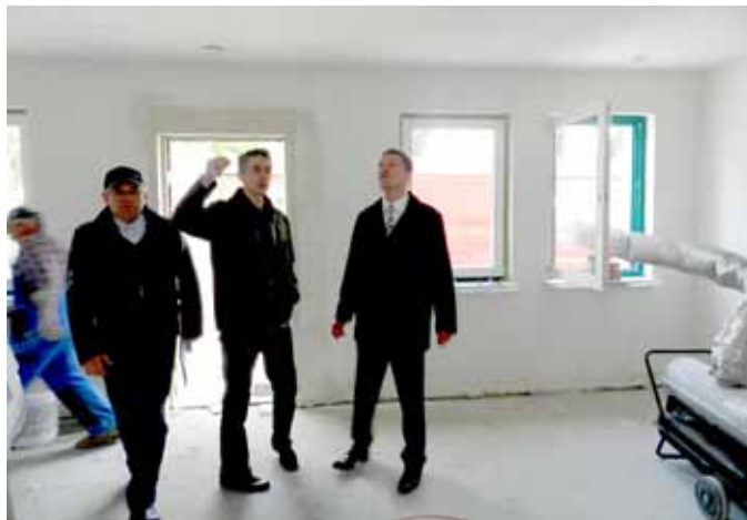
Świetlica po remoncie