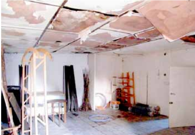
Świetlica przed remontem