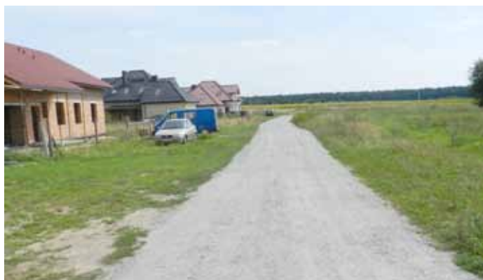
Droga na osiedle za boiskiem Orlik: Firma AZBUD zrównała teren drogi, wypełniła nierówności kruszywem i zawałowała. Koszt 14 508 złotych

z kłopotami transportowymi - brak dróg o utwardzonej nawierzchni w pobliżu budowanych domów mieszkalnych. Aby ułatwić życie już wybudowanym i potencjalnym inwestorom burmistrz podjął decyzję o utwardzeniu nawierzchni dróg na powstających osiedlach. opr. LMM