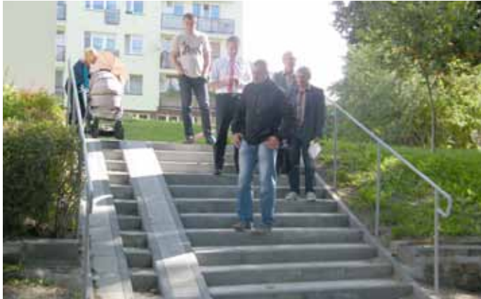
Po remoncie" dolne "Przed remontem