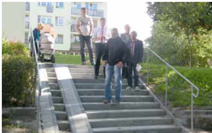
Po remoncie" dolne "Przed remontem