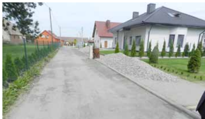
Droga w Warnkowie: Wypełniono ubytki jezdni kruszywem i zawałowano. Firma AZBUD, koszt ok. 5 000 zł