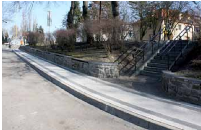
...a tak wygląda obecnie

gardzie był Pan Kamil Kleina. Roboty wykonano w terminie od 11.10.2013 r. do 23.12.2013 r. Koszt przebudowy wyniósł 18 639,00 zł brutto.