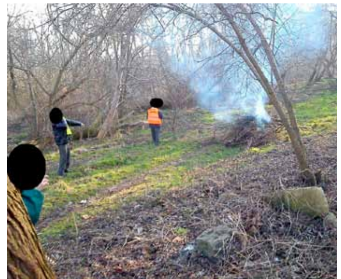
prace pielęgnacyjne na terenie przyległym do grobli oraz boiska przy ulicy Kowalskiej