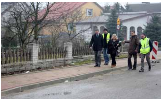
Tak wygląda obecnie fragment remontowanego chodnika