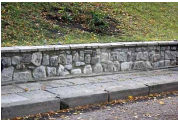
tak wyglądał chodnik przed remontem...

Pod koniec ubiegłego roku zakończył się remont chodnika przy ul. Zielonej zlecony przez burmistrza Nowogardu. Wykonawcą przebudowy chodnika w ul. Zielonej w Nowo-