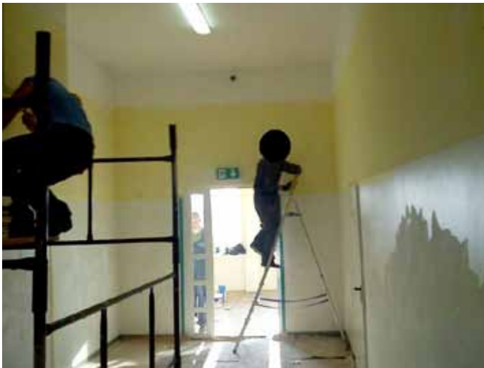
równanie oraz malowanie korytarzy i klatek schodowych w SP nr 1