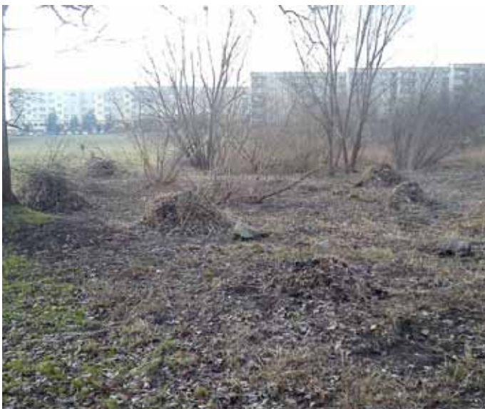
porządkowanie skarpy przy schodach przy ulicy Kowalskiej