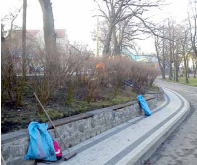
porządkowanie skarpy przy ul. 3 Maja