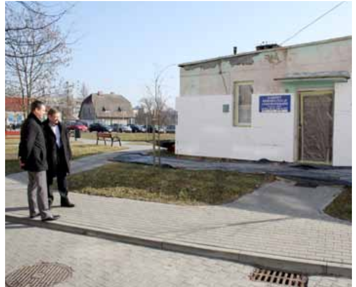
docieplenie budynku rehabilitacji przy szpitalu