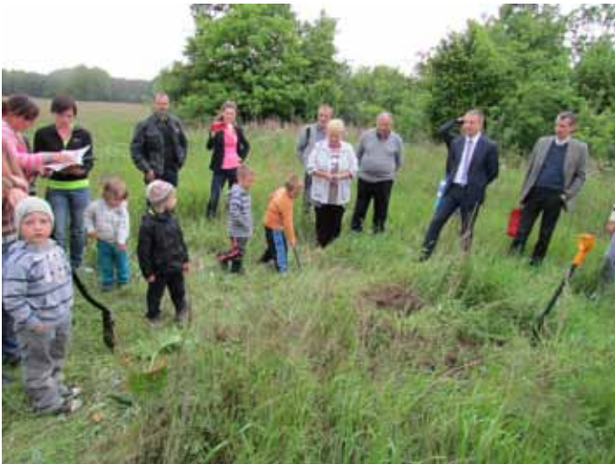
Plac zabaw w Łęgni - w najmłodszym sołectwie na terenie gminy Nowogard

Plac zabaw w Łęgni ma mieć powierzchnię 500 m 2 i wyposażony zostanie w wielofunkcyjny zestaw sprawnościowy wyposażony w wieże, zjeżdżalnię, różnego rodzaju drabinki i ścianę wspinaczkową, huśtawkę wagową, huśtawkę podwójną, bujaczek, karuzelę oraz urządzenie do ćwiczenia równowagi. Ponadto plac zabaw wyposażony zostanie w ogrodzenie, zamontowane zostaną ławki, kosz na śmieci oraz tablica regulaminowa. Koszt całkowity inwestycji wyniesie 45.498 zł.