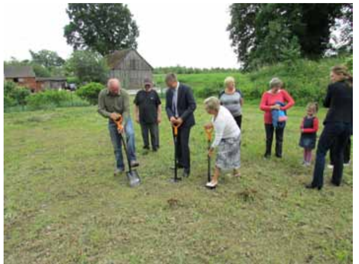
Karsk będzie miał plac zabaw

Plac zabaw w Karsku ma mieć powierzchnię 154 m 2 i wyposażony zostanie w wielofunkcyjny zestaw sprawnościowy z różnego rodzaju drabinkami, poręczami, huśtawkę wagową, huśtawkę podwójną. Ponadto plac zabaw wyposażony zostanie w ogrodzenie, zamontowane zostaną ławki, kosz na śmieci oraz tablica regulaminowa. Koszt całkowity inwestycji wyniesie 25.547 zł.