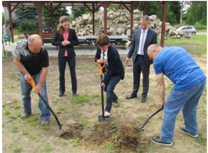
Rusza budowa placu zabaw w Sąpolnicy

Plac zabaw Sąpolnicy ma mieć powierzchnię 500 m 2 i wyposażony zostanie w wielofunkcyjny zestaw sprawnościowy z różnego rodzaju drabinkami, poręczami i uchwytami służącymi do podciągania się, huśtawkę wagową, bujaczek, huśtawkę podwójną i karuzelę. Ponadto plac zabaw wyposażony zostanie w ogrodzenie, zamontowane zostaną ławki, kosz na śmieci oraz tablica regulaminowa. Koszt całkowity inwestycji wyniesie 46.765 zł.