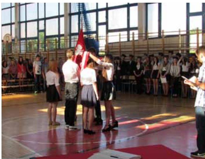
Publiczne Gimnazjum nr 3 im. Zjednoczonej Europy w Nowogardzie