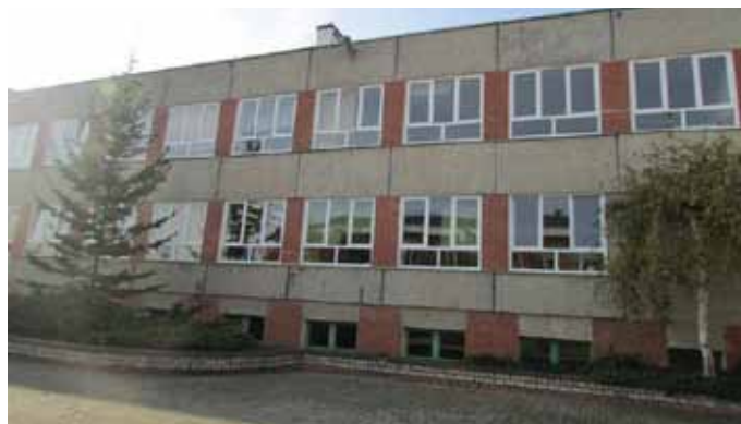
Okna po remoncie