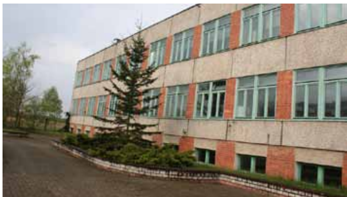
Przed wymianą okien