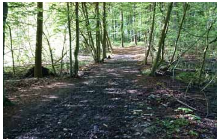
Ścieżka dookoła jeziora