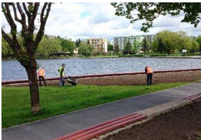
W czasie prac