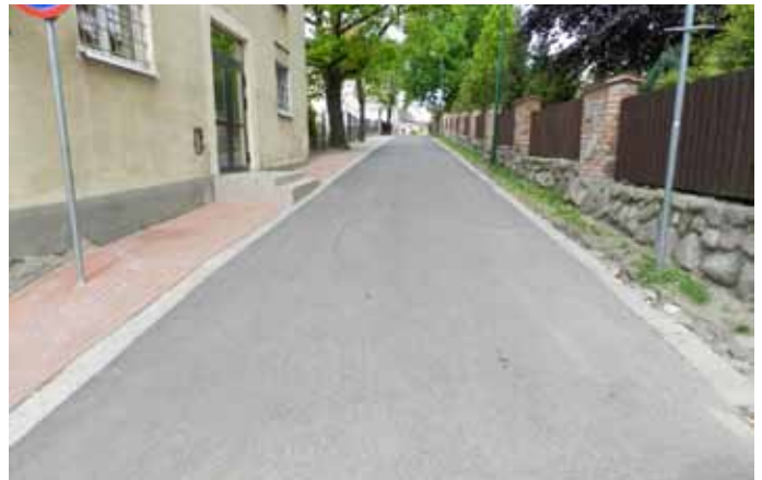
Ulica Szkolna po remoncie