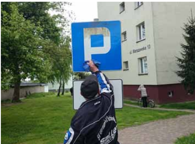
Konserwacja oznakowania drogowego