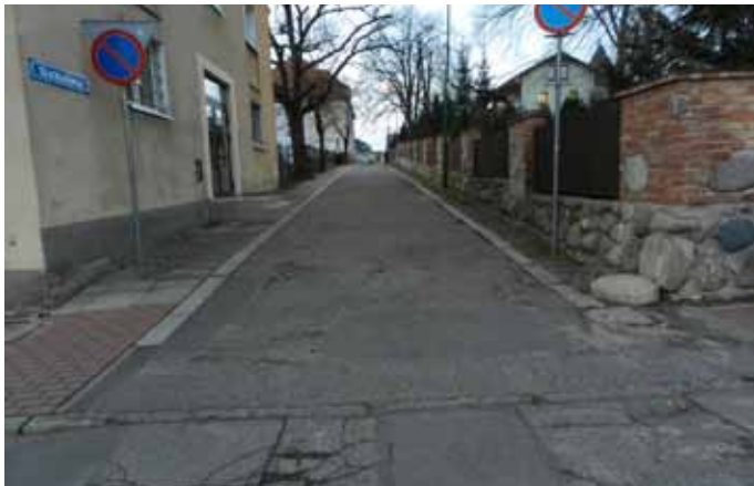
Ulica Szkolna przez remontem