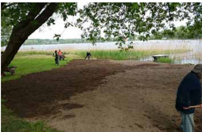
Wyrównywanie terenu nad jeziorem