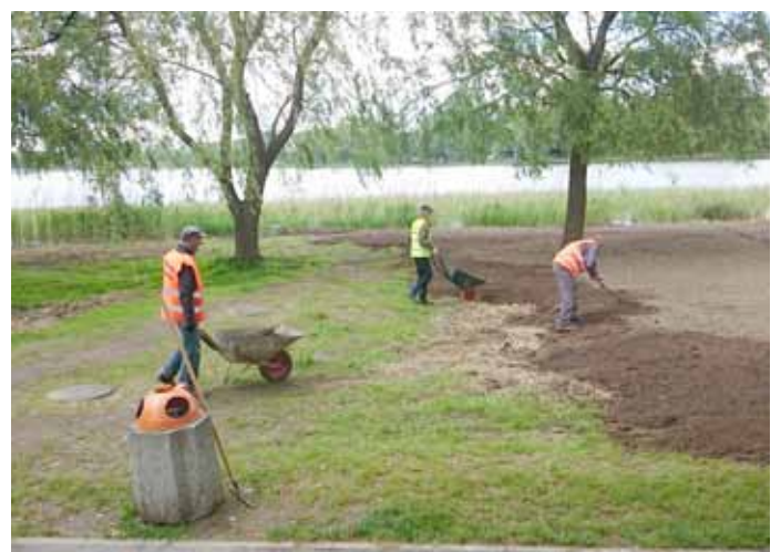
- odbudowa zieleńca ciąg dalszy - ul. Zielona.