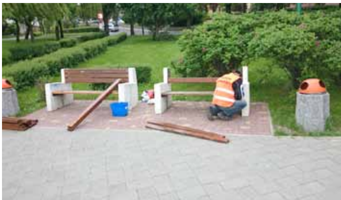
- naprawa zdewastowanych ławeczek;