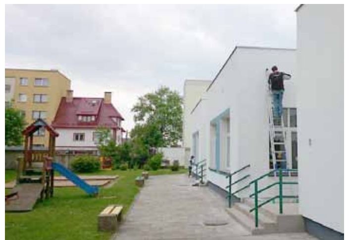
- prace wykończeniowe przy remoncie elewacji Przedszkola nr 3;