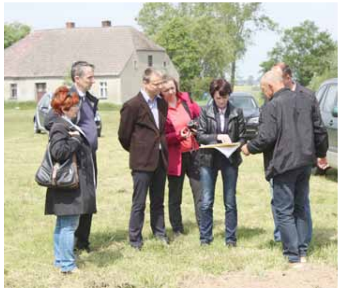
Ustalania odnośnie miejsca nowej świetlicy w Wyszomierzu