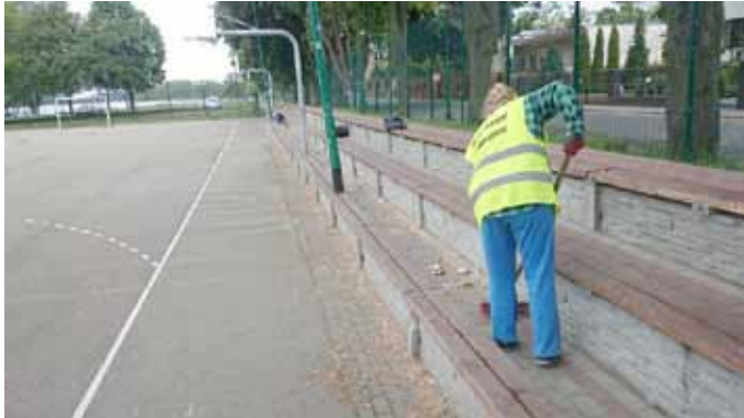
- sprzątanie na boisku przy pl. Szarych Szeregów;