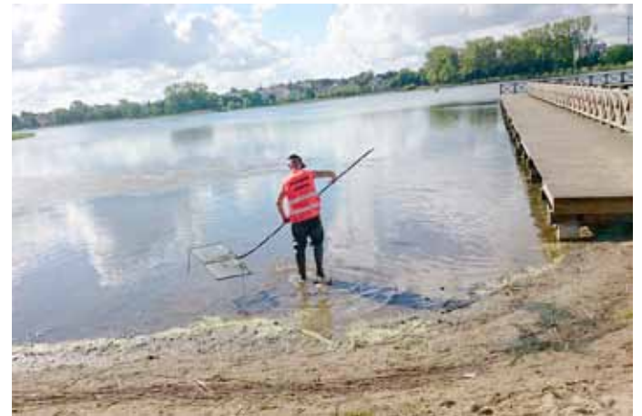
- oczyszczanie jeziora z glonów;