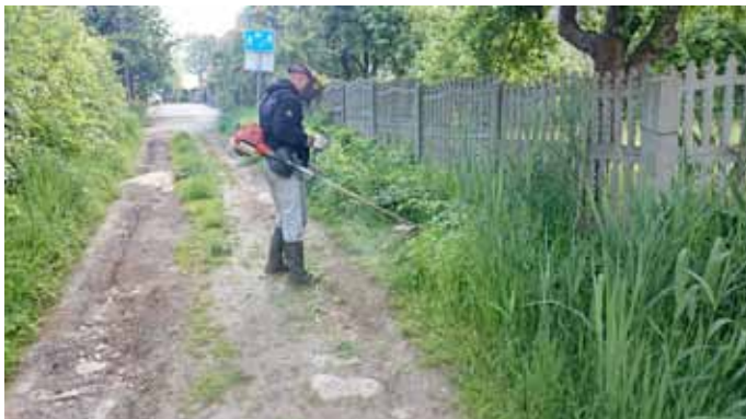
- koszenie przycinanie krzewów wrastających w światło drogi oraz usuwanie śmieci przy ul. Okulickiego i Sikorskiego;