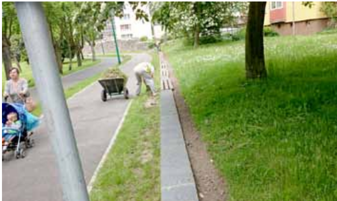
- ławeczki przy ul. Osiedlowej (oczyszczenie z przerastających chwastów);