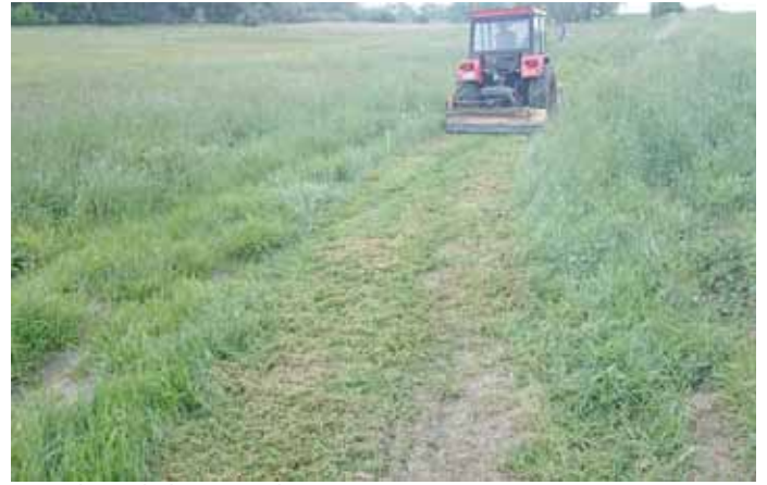
- ścieżka wokół jeziora – koszenie;