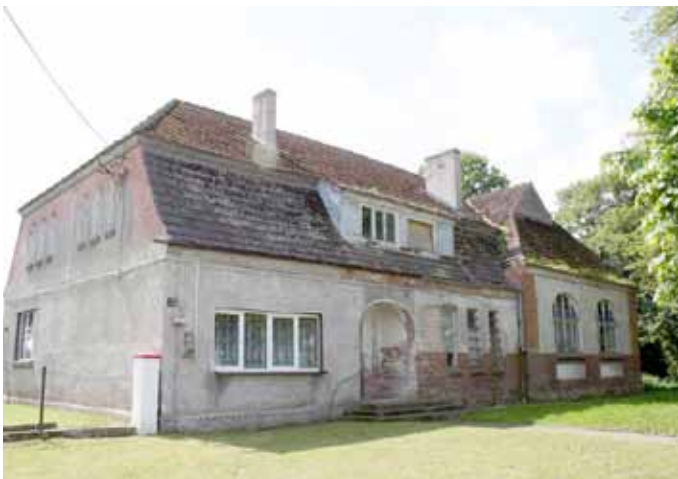
Budynek obecnej świetlicy - w stanie katastrofalnym

rozmowach z sołtysiem przedsiębiorca zadeklarował, iż pomoże w wymianie urządzeń na placu zabaw w Wyszomierzu.